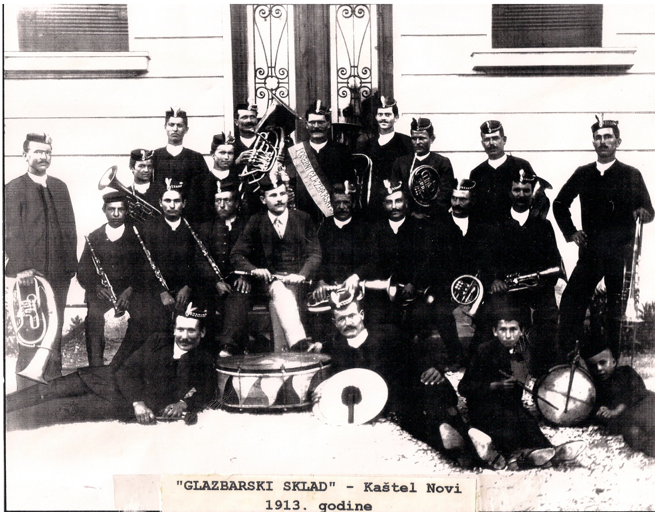
Glazbarski sklad Kaštel Novi 1913. (ispred novootvorene osnovne škole)