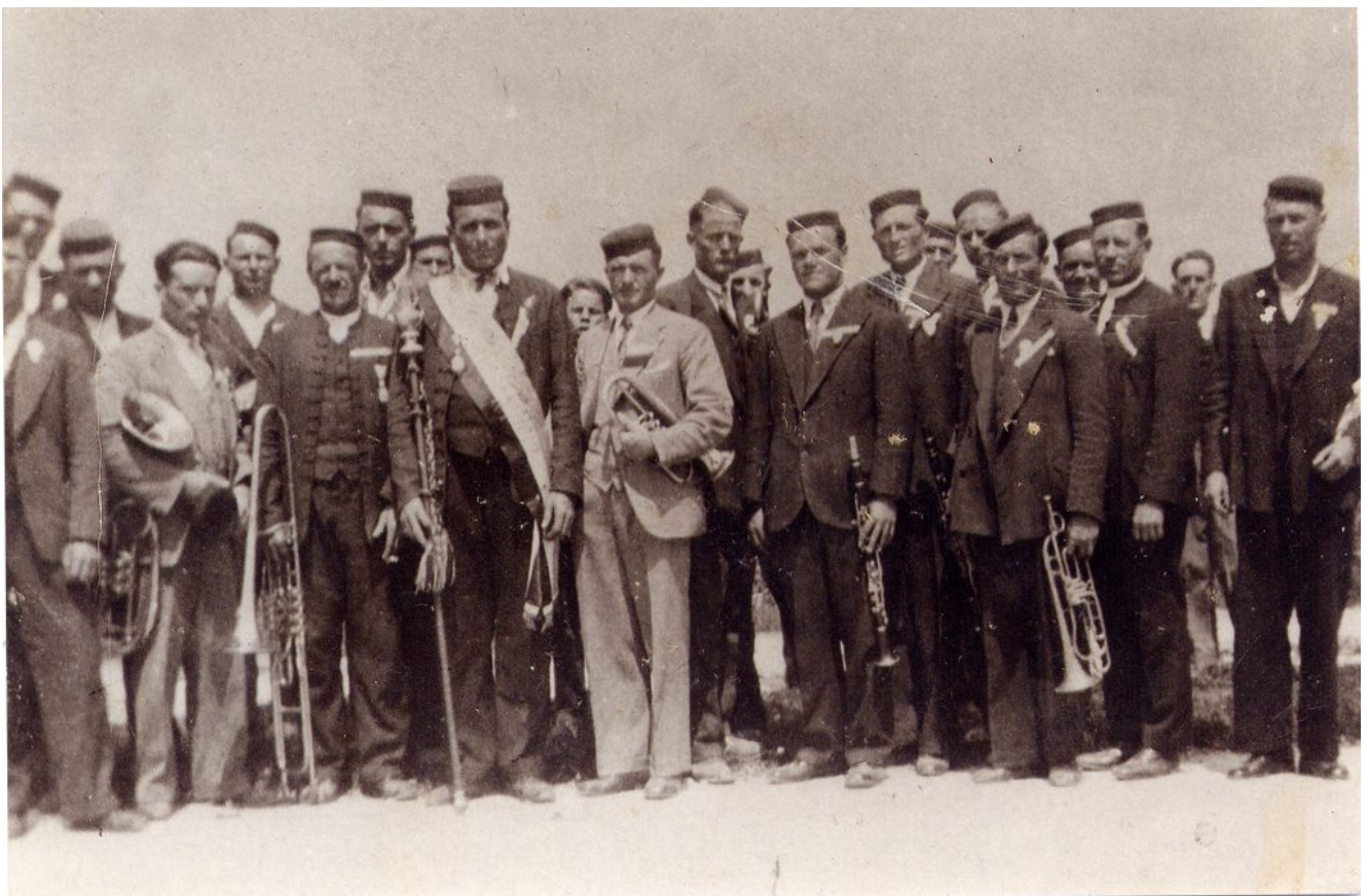
Glazbarski sklad u Kaštel Novom, rane 1900-te