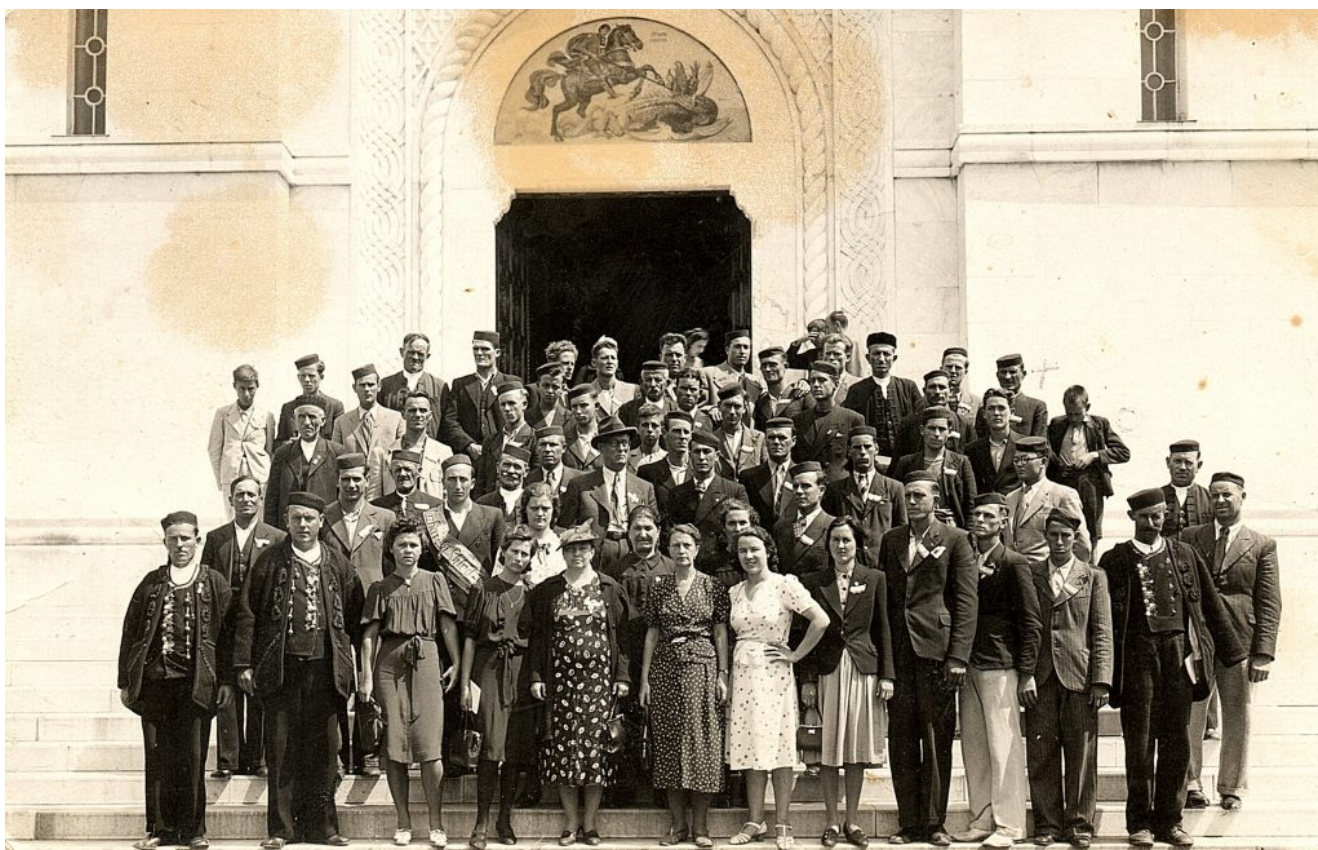
Glazbarski sklad na izletu u Oplencu (ispred crkve sv. Đorđa) Srbija 1937.